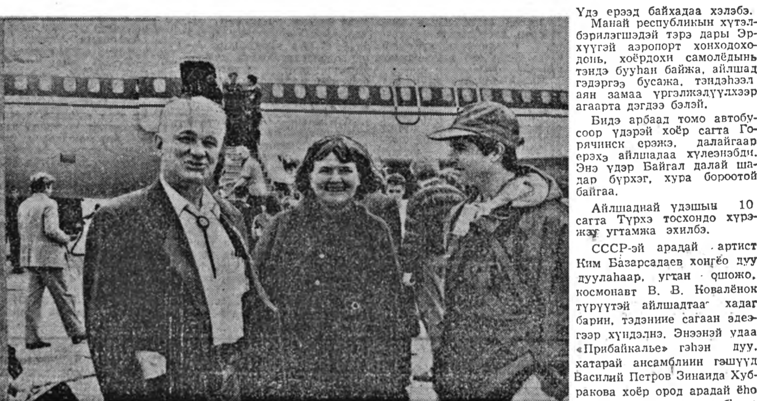
Удэ ерээд байхадна хэлбэ. Манай республикын хүтэл-бэрилгэлшэй тэрэ дары Эр-хүүгэй аэропорт хонходохо-донь, хоёрдохи самолёдын тэндэ бууһан байжа, айлшад гэдэргээ бусажа, тэндэһэл аян замаа үргэлжлүүдхээр агаарта дэгдээ бэлэй.