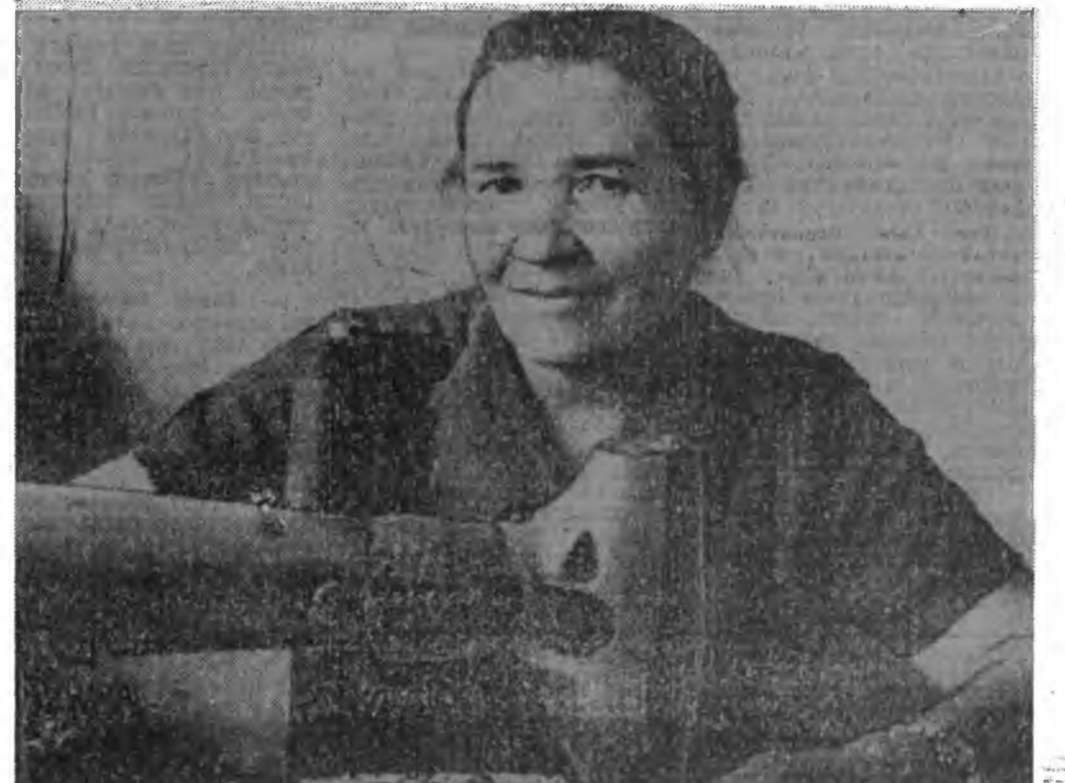
Гусинкозекский «Радуга» ательсэд эрө хүнэй гадар хубсаа өсдөг нөх ху...