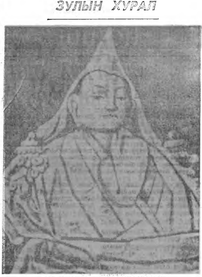
НОВЯБРЬ 26-ДА БОГДО ЗОНХОБЫН ТАГААЛАЛ БОЛОХООР 575 ХЭДЭЭНИ СНИ ГҮНСЭВЭ.

«Буряад үнэн» сониний болон Россин Буддын шажантай түбэй захиргаанай үмэнэһөө тус хууданай харадаа нэгэ удаа хэблэгдэн гарадаг. Ноябрь, 1994