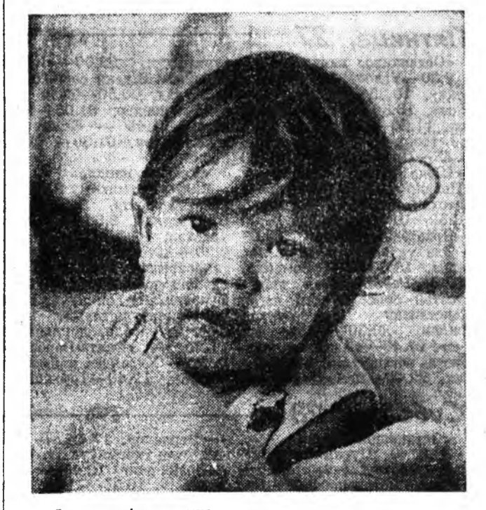
Бэрин гэгээн гэжэ...

Аралтай Ярууны хойто бэдэ — Алларга үндэр Баян-Хаан Алагхан зүрхэндэ маргадгагүй Айрхан гансахан нүхэри, Байгаахан Ярууны хойто эрьдэ Багарга шулуутай хабсагай бин. Багдайран ямада һанадагдэг. Багаһан хаан басагдгай бин. Далантай Ярууны хойто бэдэ Дабан үндэр Баян-Хаан. Дашуурма наһанай залуу үеин Кангина басаган гансахан лэ. Тохойтой Ярууны араханда Түргэһэн уһатай Тулуун бэлэй, Тавилсан олон нүхэдүүд соо Тангилхан сэрбэ басагай бэлэй, Ургыгаар бурхэн Ярууны эрьдэ Улаанхан үгэтэй хабсагай бин. Ухаан бодолһон һаладаггүй Уэльэн гансахан басаган бэлэй. Ялартай ябад хүрэлдэ Ярууны нуурууд хайхан бэлэй. Ямарханшье сагай нооо наа, Ярууны юртэмсэ мүнхэхэн лэ! М. ДАНИЛОВА.