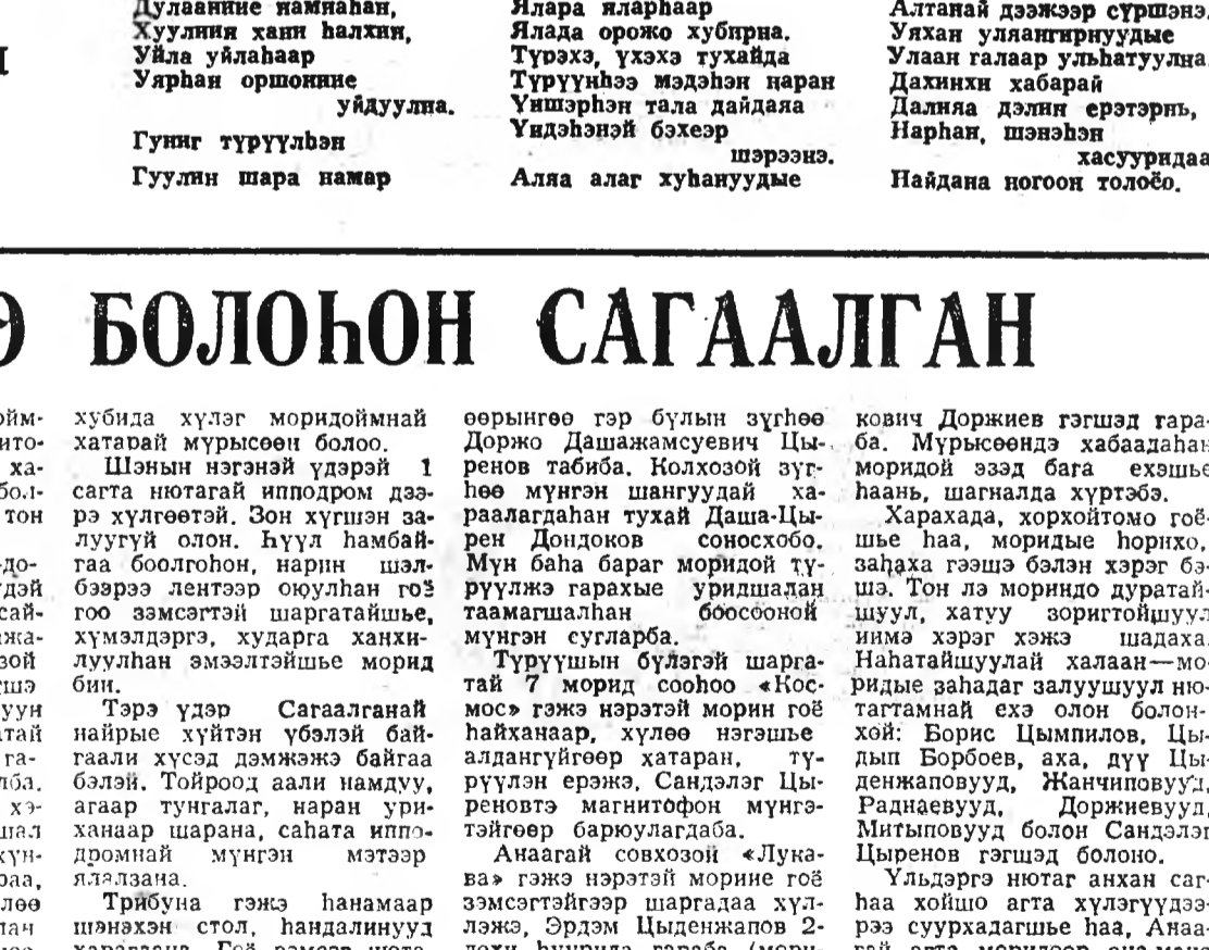
«Буряадай түүхэ» гэдэг үгсэ... «Буряадай түүхэ» гэдэг үгсэ... «Буряадай түүхэ» гэдэг үгсэ...