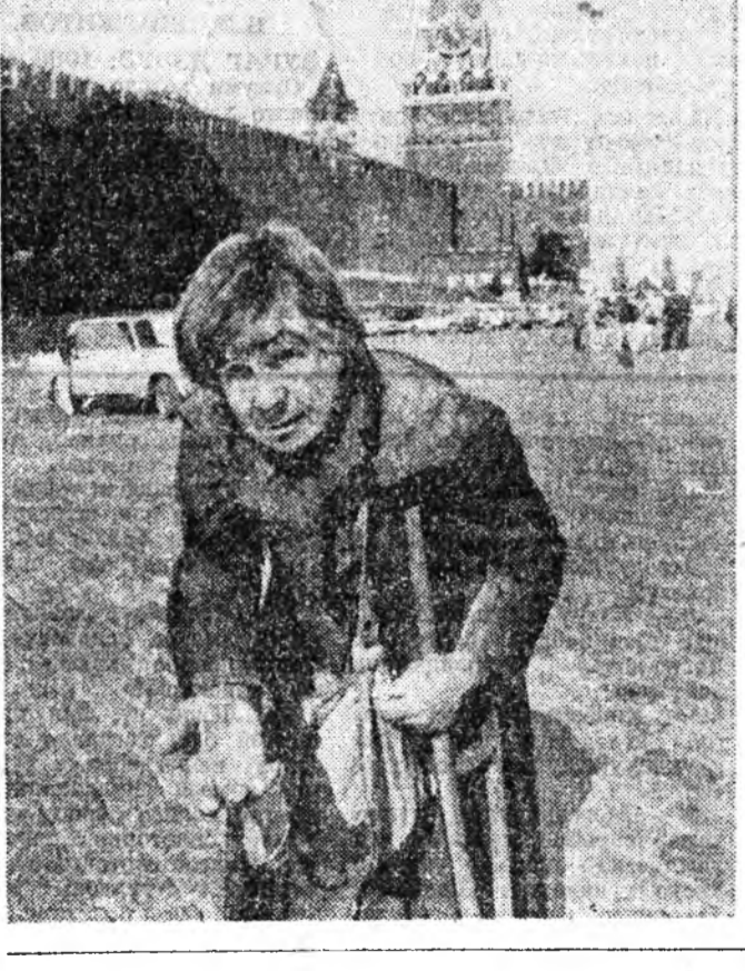
«Буряадай түүхэ» гэдэг үгсэ... «Буряадай түүхэ» гэдэг үгсэ... «Буряадай түүхэ» гэдэг үгсэ...