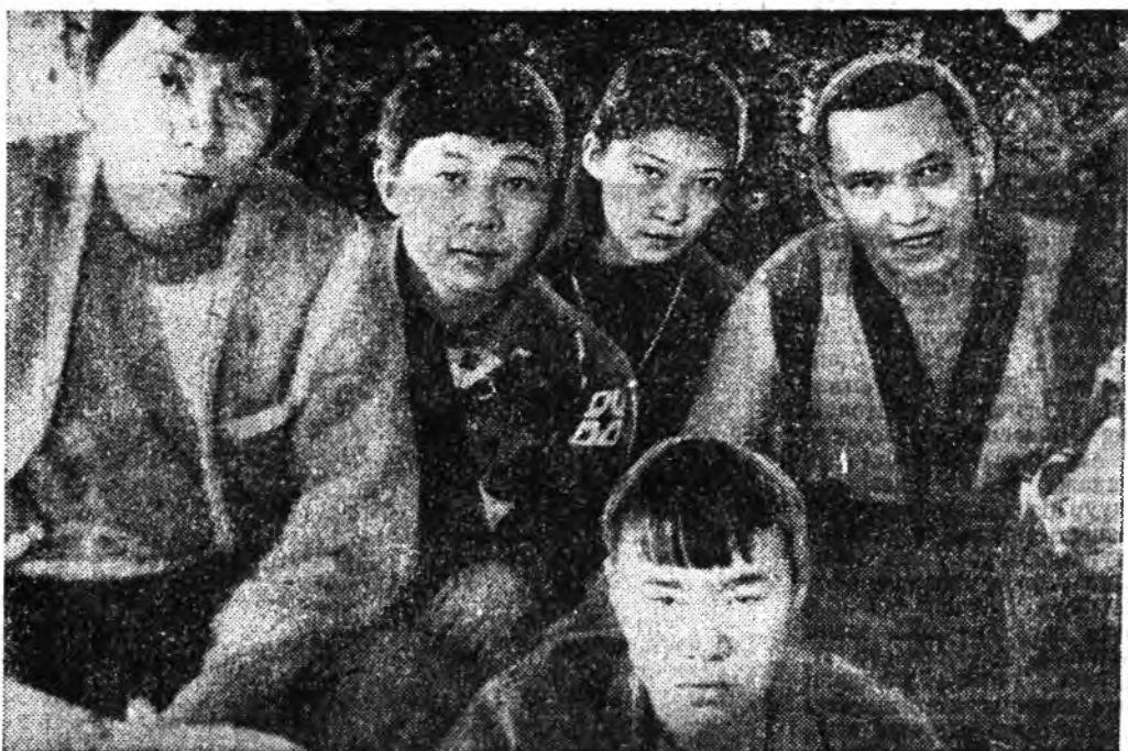
Хээр хэлбэл, гэр гээшэ мүн лэ абарал болно (хүйтэн-һөө абарал). Гэбшье гэр ийдэмтэй абарал бэше, Гэртай хандархада болохо. Энэ ушарга абарал болохо шалтгаан болохо масал.

ДАЛАЙ ХЭШЭЭЛ Төвдэр олон шонэ хүрэн хэблэлдэ эрээ һэн мэралай сахил, тарин дабтахай лун хүртөөн. Урда тазын сахил, мандай бабал, дахин тэжээ болохо юм. Тинлэйн сахил, дунтай бүри тэжээ болохо шуу. Далай гүрээтэ Далай ламын толгой дээрэ мүнөө гэгэ бисалгаад, ЯНГИЙН ТАРИН НАМУУ ГҮРҮВЭ, НАМУУ ШААЛА, НАМУУ ДАРГА, НАМУУ САНГАЯА дабтагыг (бурыдаар манда мургэнбэ, Бурхан гүрэнбэ, Номдоо мургэнбэ, Бурхан хубарагуудтаа манда, — согсологшын тайлбар).