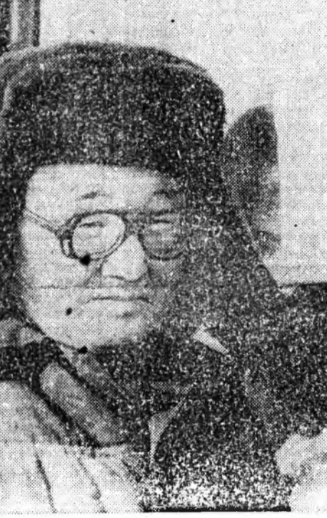
Малай үбэлжэлгэ-шанга шалгалта

«Эд хэрэгшэһэдэй эрхэнүүдэ хамгаалха тухай» Россия Федерациин Хуулинэй Конституцион комитетин дэһэн хэблэхэ гээд хэдэхэ хүсэлтэй.