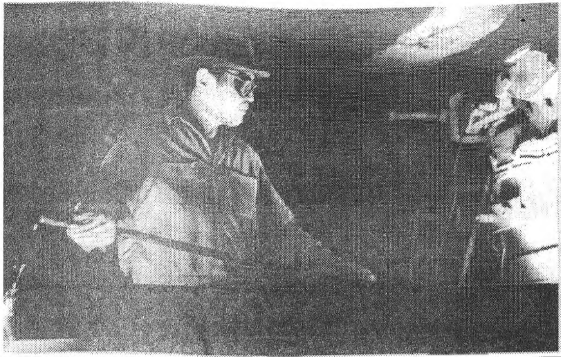
Үглөөдэр - Металлургын үдэр