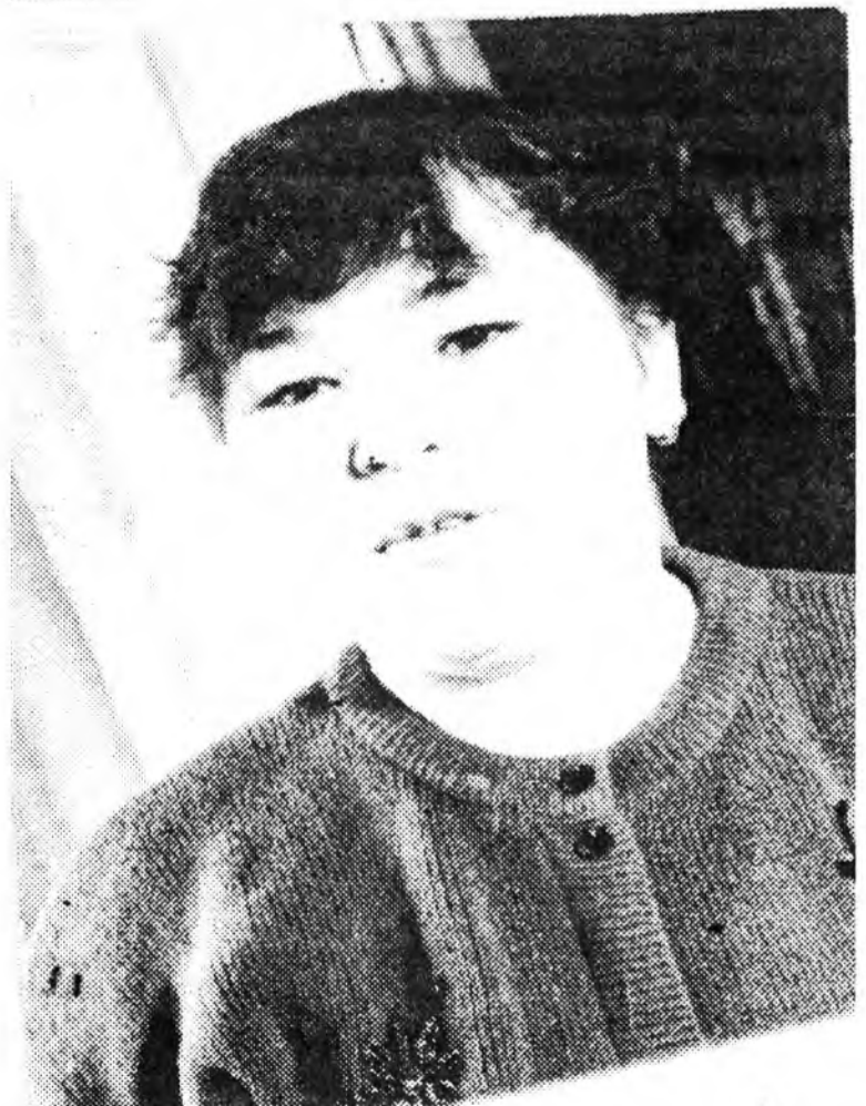
ЗУРАГ ДЭЭРЭ: Ивалгын аймагай һуралсалай "Байгал" ажахын Посольскийн һүнэй фермын үншэй дүршэл