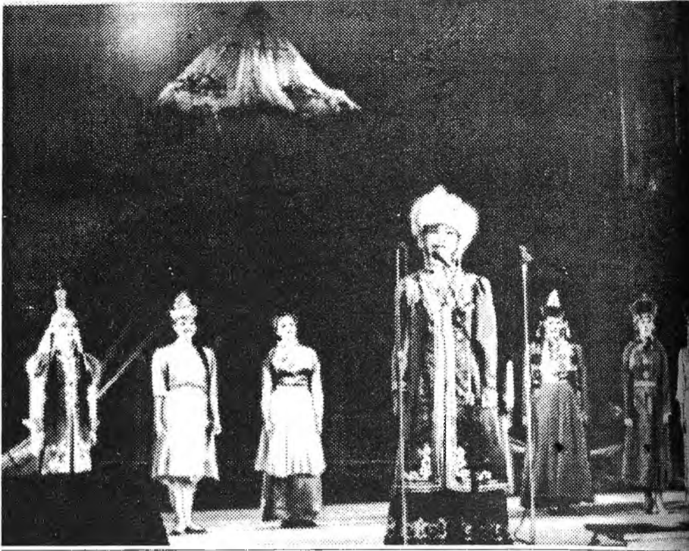
Элүүр энхын булан