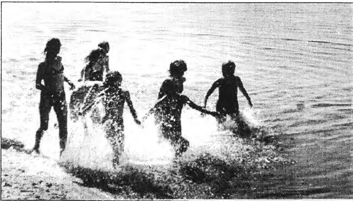
Хүн ба байгаали