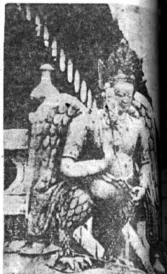
Холын аяншалгаһаа бусахадаа