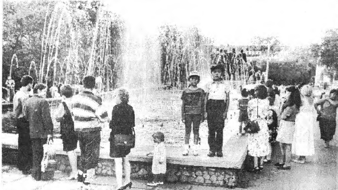
ЗУРАГ ДЭЭРЭ: фонтанай фотографттой.

ДЭМЫ НЭРЛЭДЭГГҮЙ ЭНОТОЙ 1969 оной март соо гүрэнэй хилэ хамгаалжа наһа бараһан Советскэ Союзай Герой Демократ Владимирович Леоновой угсаатанай дүрбэн үөнэ хилын харуулаһад байгаа. Тиймээхэ Архангелск хотын районуудай нэгэн болохо Коломбалада байдаг түрэлхидэйнь гэрые нютагаархидын "застава" гээд дэмы нэрлэдэггүй байгаа ёһотой. Валентин Пикулийн "Океанский патруль" гэжэ хоёр номһоо бүридэһэн романай гол геройнуудай нэгэн болохо тагнуулаһан-лейтенант Ярцевай прототип боложо үгэһэн хүн Советскэ Союзай Герой Михаил Иванович Филип байгаа. Тэрэ Коломно хотодо түрэнһэн юм. 1962 ондо Совет Армиһаа табидаа. Тийхэдээ подполковник зэргэтэй байгаа. 1970 ондо наһа бараа хэн. ("Шиг и меч" һонинһоо).