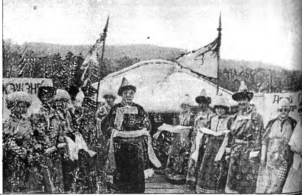
Хэжэнгын аймагай түлоолгшэд һайндэрэй үедэ.