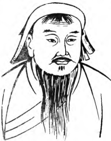
(Үргэлжлэл. Эхинийн сентябрийн 5, 6, 7, 8, 12, 13, 14, 15, 19, 21, 22, 26, 27, октябрийн 3, 4, 5, 6, 10, 11-нэй дугаарнуудта).

КАБУЛ ХААН - Монголой "Нюуса тобшо" хамаг монгол уласые Хабул хаан толгойло байба гэж бэшээтэй байдаг. Хабул гэж Чингис хаанай элинсэг эсэг болоод хамаг Монголой анхнай хаан юм.