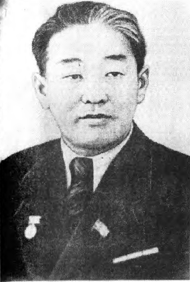
СССР-эй арадай артист Г. Ц. Цыденжаповай 90 жэлэй ойдо

ЗУРАГ ДЭЭРЭ: СССР-эй арадай артист Г. Цыденжапов.