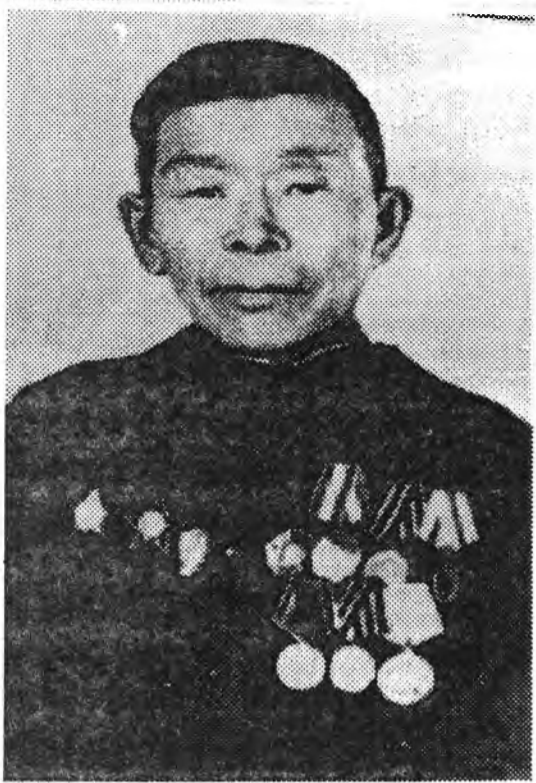
Юнэ дахин шархатажа, госпиталь болон медсанбалуудта хэвтээ. Аргалуулһанайнгаа удаа хайшань захирнаб — тийшэл ошодог хааб даа.

Хэды зүрхэтэй, шадабаритай, оролдосотой, шэрхишье наа, бээдээ ехэ анхарал хандуулмаар хөөрөөж ууража байдаггүй, номгон зантайхан, һайн һанаатай хүнийе шэнэ командирнууд хаанаһаа абаһаар ажаглаадхихаб даа. Арай гэжэ тагилсаһаар байгараа баһал шархаташоо гүбэ.