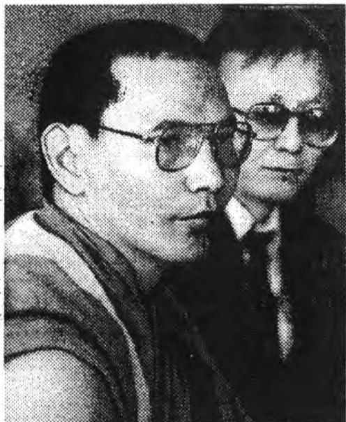
(Урдахи хэшээл июлиин 28-да гараа)