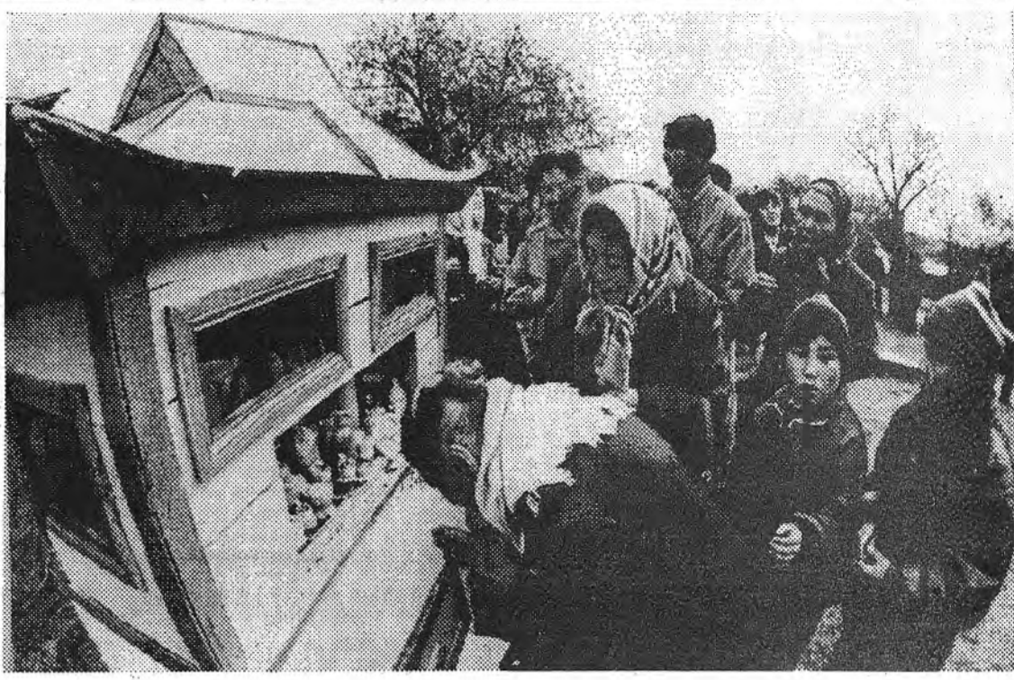
Балдан-Брэйбун дасанда мүргэлшэд гороо хэнэ.