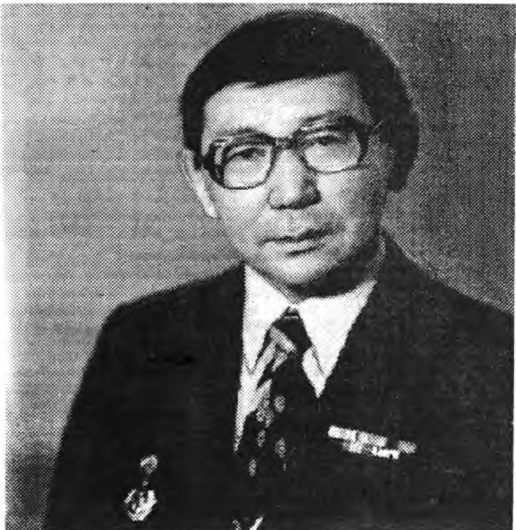
Эрдэмтын 70 жэлэй ойдо