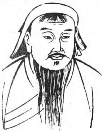
(Үргэлжлэл. Эхинийн сентябриин 5, 6, 7, 8, 12, 13, 14, 15, 19, 21, 22, 26, 27, октябриин 4, 5, 6, 10, 11, 12, 13, 17, ноябриин 1, 2-ой дугаарнуудта).

ЧИНГИС ХААН - Монголой гүрэн түрье үндэһэлэгшэ Тэмүжэниие Чингис хаан гэдэг бэлэй.