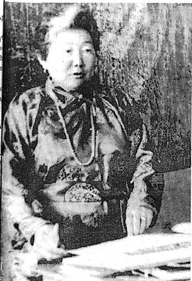
Э. Будаевай фототекст.

Жэшэнь, документнүүдэйнгээ али нэгэнэй дутаа һаань, ханаагаа бү зобогты, яаралгүйгөөр, болгоомжотойгоор ябажа, хэрэгтэй справкануудаа бэлдэхэдэтай болохо. Ажаһуудаг газарайтнай ажалаар хангалгын түб алишые сагта, жэлышые дахин ерэхэдэтай, арсаха ёһогүй".