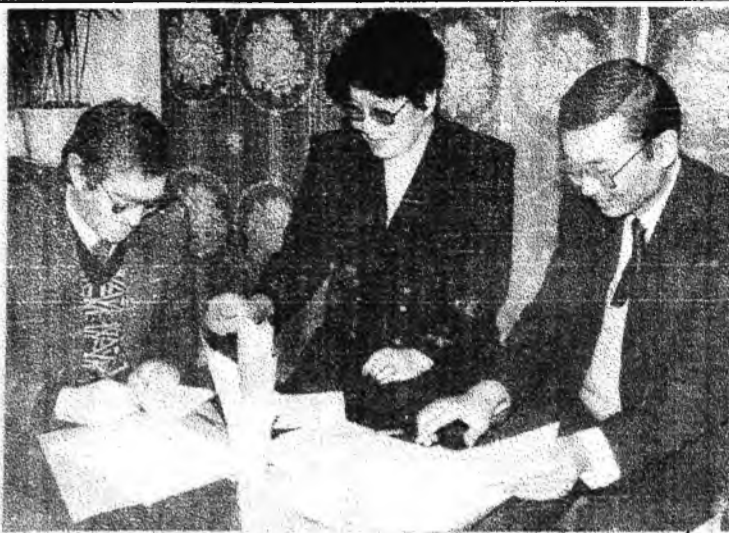
Февраль нагада Улаан-Үдэ хотымнай Ж. Тумуновой нэрэмжэтэ библиотекын дэргэдэхи сэхээтэнэй клубай байгуулагдаһаар хоёр жэл гүйсэбэ. Клубай ээлжээтэ уулзалга энэ ойдо зорюулагдаа юм.

Үнгэрхэн хоёр жэлэй туршада хотын библиотекын тиймэ ехэ бэшэшье наа, аятайхан танхим соо олохон уулзалга, выставкэнүүд, уран зохёолой салон, танилсалганууд боложо, эрхимэй эрхим сэхээтэн, поэдүүд, уран зохёолшод, зурашад, артистнууд, эрдэмтэд, хүтжэмшэд суглардаг байгаа.