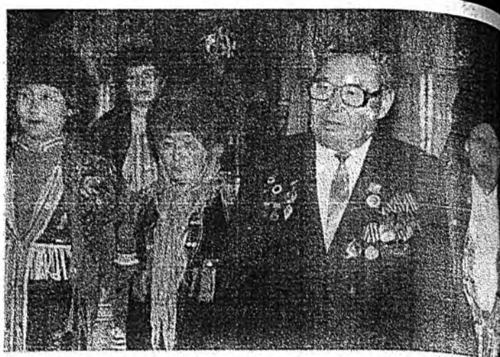
Тайзан дээрэ - кабанскынхид.