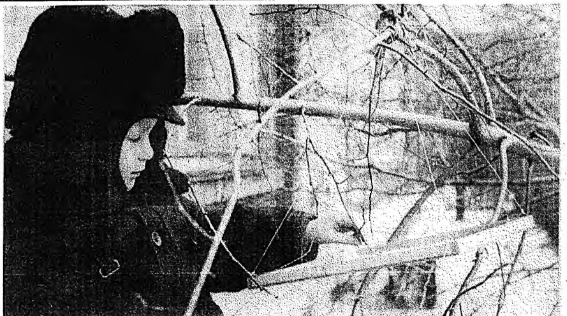
Эдеэлхээе ерыт даа, шубуухайнууд!

Түүхэй мяхаар олон шубууд хооллодог. Жэшэнь, хулганын, ондатрын, хэрмэнэй мяхан, гэрэй мал гаргахада үлэхэн гэдэхэ дотор, шубуунай, таһагай дотор гэхэ мэтээр үбэлдөө шубуухайнууды хаа-яашье хаа, тэжээхэдэ болохол ааб даа. Шабын түмэртэ гү, али оһорто уяжа, али гэбэл, һөөгүүдэй мододой гэшүүһэндэ тараажа үлгэдэг юм.