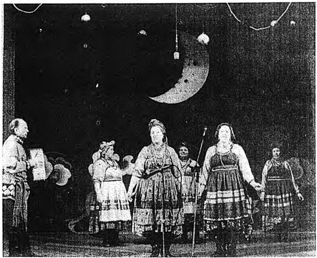
Тайзан дээрэ — бэшүүрэйхид.

ЗУРАГ ДЭЭРЭ: Арзагун тосхоной баатарнуудай хүшөө.