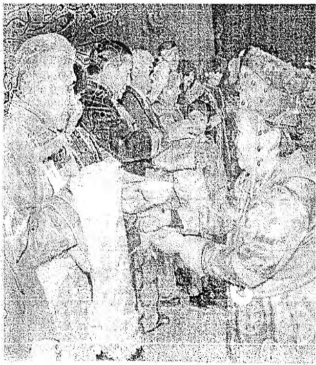
Сагаалган-96. загарайнхидай, хаягтынхидай уулзалга.