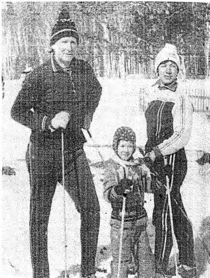
Гэр бүлөөрөө сэбэр агаарта.