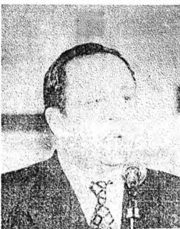
Манай эндэхи немец яһананай өөһэдынгөө соёл болбосоролые һэргээн, угсаатанайнгаа эблэл эмхидхэхээрнэ табан жэл март нарын эхээр болобо. Энэнтэй даншарамдуулан, хотын захиргаанай байшангай ехэ зал соо баяр ёһололой үдэһиз үнгэрэгдэбэ.

Тус эблэлдэ хэд ороноб гэхэдэ, гансашье немец яһанай угсаатан бэшэ, мүн лэ Германиин соёл болбосоролоор, хэлээр һонирходог буряад, ород хүнүүд олон биш. Сугларагшиад тэрэ үдэһиз һонирхолтой зугаа наада дэлгэжэ һуухадаа, немец хэлэн дээрэ дуунуудые дуулалдажа, шүтэһүүдые уран гэрөөр уншажа, бэе бээтээ танилсаа, Олонхышэ энэ 5 жэлэй хугасаада бэе бээе һайн мэдэхэ, таниха болонхой.