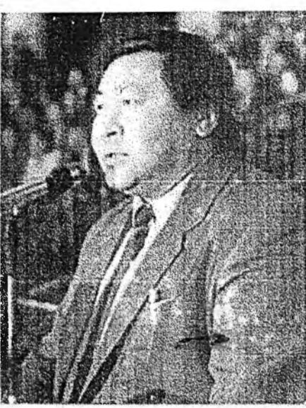
Сагта бэелүүлхэ хэмжээнүүдые зохёохо хэрэгтэй;

Үндэһэн яхатанай-соёлой гүрэнэй политикые бэелүүлхэ, али болохоор дэмжэхэ хүдэлмэридэ ВАРК эдэбхи үүсхэлтэйгээр хабаадаха байһанаа элирхэйлнэ. Ушар нимһээ Россин Федерацин үндэһэн яхатанай хоорондохи харилсаануудай гол шэглэлнүүдэй үшөө бэлэн болошыггүй һаань, ВАРК энэ амин шухала асуудануудаар оорынгөө бодомжонуудые бэлдэжэ байна. Энэ шухала хэмжээ ябуулануудаа 1998 ондо дүүргэжэ, бүгэдэ арадай үзэмжэдэ табиха зорилго харааланхайбди. Энэһэнээ уламжалан, эгээл мүнөө үедэ иимэнүүд асуудалнуудые тодорхойлохо гээд: буряадууд үндэһэн арад боложо, уласхоорондын эрхын субъект боложо шадана гү; орон дотор областнуудта, округуудта болон республикада үндэһэн яхатанай хоорондохи харилсаанууд ба политическэ байдал ямар бэ; кадрнуудые бэлдэхэ ба хүмүүжүүлгын, Россин Федерацин, Буряад Р е с п у б л и к ы н Правительствануудай, округууд болон областнуудай абаһан хуулинуудай, зарлигуудай, тогтоолнуудай ямараар бэелүүлгэдэжэ байһан, эблэрүүлгэ тухай; арадай ёһо заншалнуудые, эрдэм һуралсалые, үндэһэн хэлые, соёлые хүгжөөхэ, һэргээхэ хэрэг ВАРК-ын гол зорилгонь болоно. Энэ шухала хүдэлмэри үргэһөөр ябуулагдажа эхилһээр хэдэн жэл үнгэрбэ. Гэбэһые энэ хэрэгээ улам нарижуулан эмхидхэжэ, хүн бүхэндэ ойлгуулаха шухала. Саашадаа Бүгэдэ буряадуудай үндэһэн соёлой эблэлэ ЦДУБ-тай, зохёохы холбоонуудтай, нотаг зоний эблэлнүүдтэй нягта холбоотойгоор ажаллаха юм. Республикын, округуудай, районнуудай онсо шэнжэнүүдые хараалжа, тодорхойлохо, һаяын