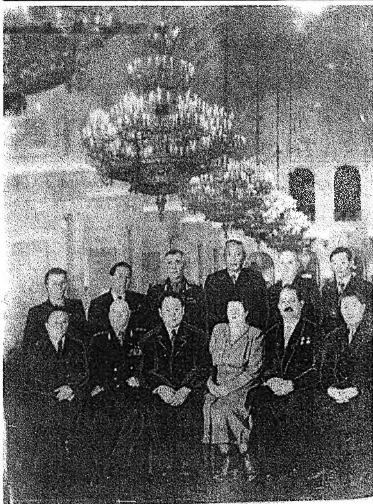
(Түгэсхэл. Эхинийн апрелин 9-нэй дугаарта)

Яруунын аймаг Республикын тон хуушанай аймагуудай тоодо ородог юм. 1927 ондо тус аймаг захиргаанай талаар тусгаар эрхэ зэргэтэй боложо, амяаран гаража тогтоо хэн. Тиймэ болохоороо 1997 оной сентябрь соо Яруунын аймагай байгуулагдаһаар 70 жэлэй ой гүйсэхэнь гэшэ. Энэ нютаг тухай урда тээн зарим тэдэ ойлгосотой байһанаа дээрэ бэшэ хэмби. Харин мүнөө хам орожо, бүхы өөрынгөө нюдөөр харахадаа, баян, холын хараатай нютаг байһыень, ямар ажалша, буряад, орд, бусад үндэхэтэнэй эндэ эбтэй этэй ажаһуудаг, ажалладагы батаар ойлгоо бэлэйб.