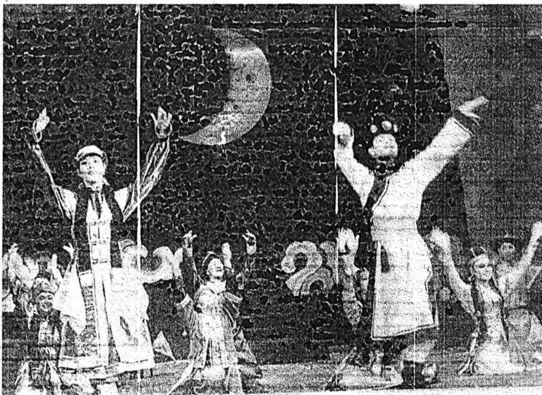
Суута "Бадма лэнхобо" ансамбль Москвада үнгэргэгдэһэн Буряад ороной үдэрнүүдэй һүүлээр Тайвань гүрэндэ бэлиг шадабарияа харуулхаяа ошоһон юм. Майн эхээр Франци, Итали гүрэнүүдээр гастролдо гараба.

ЗУРАГ ДЭЭРЭ: "Бадма лэнхобо" тайзан дээрэ.