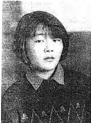
Галтайхан нюдөөрөө эмнээрэй. Шэдитэ найхан улаалзай Шэнээр дахин ургаарай.