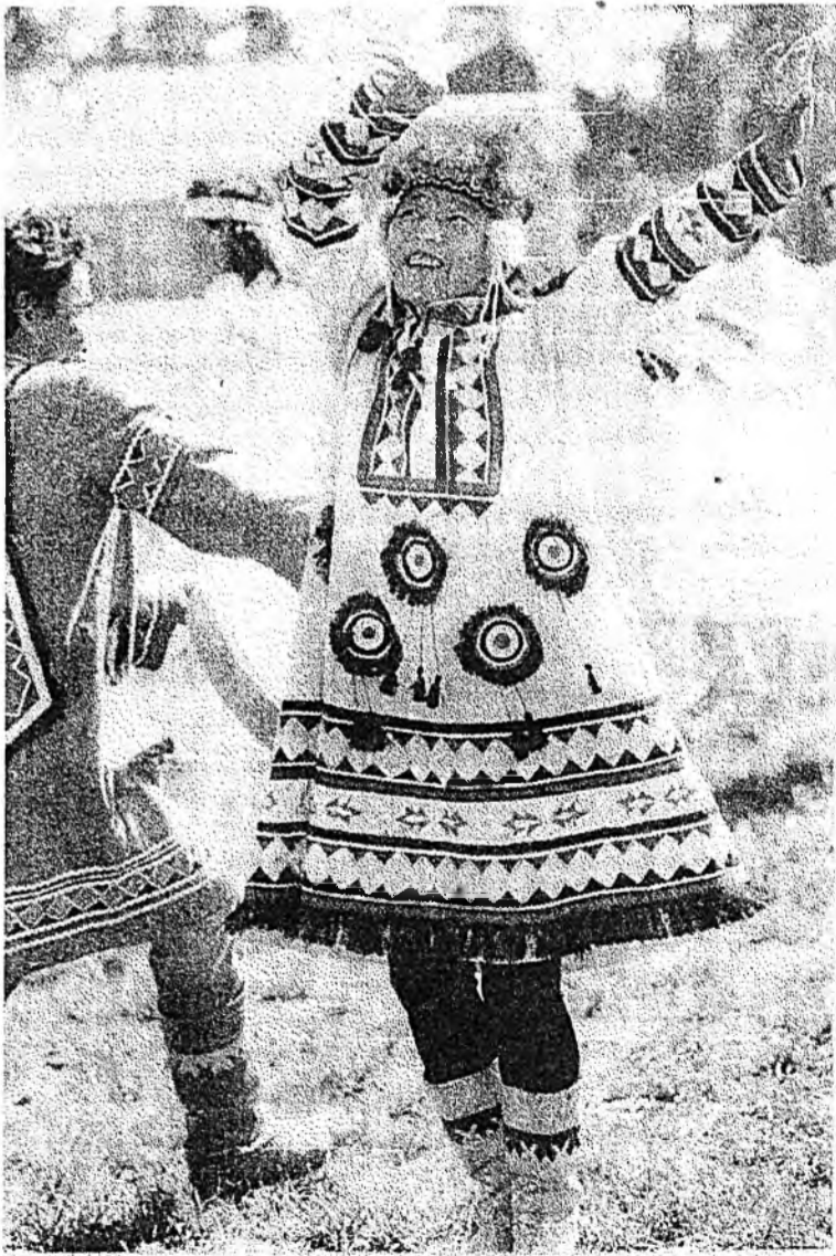
Оротоной хатар хайхан даа.