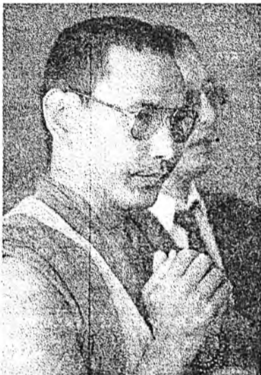
ХҮМҮҮНЭЙ ЭРДЭНИ ШУХАГ ТҮРЭЛ