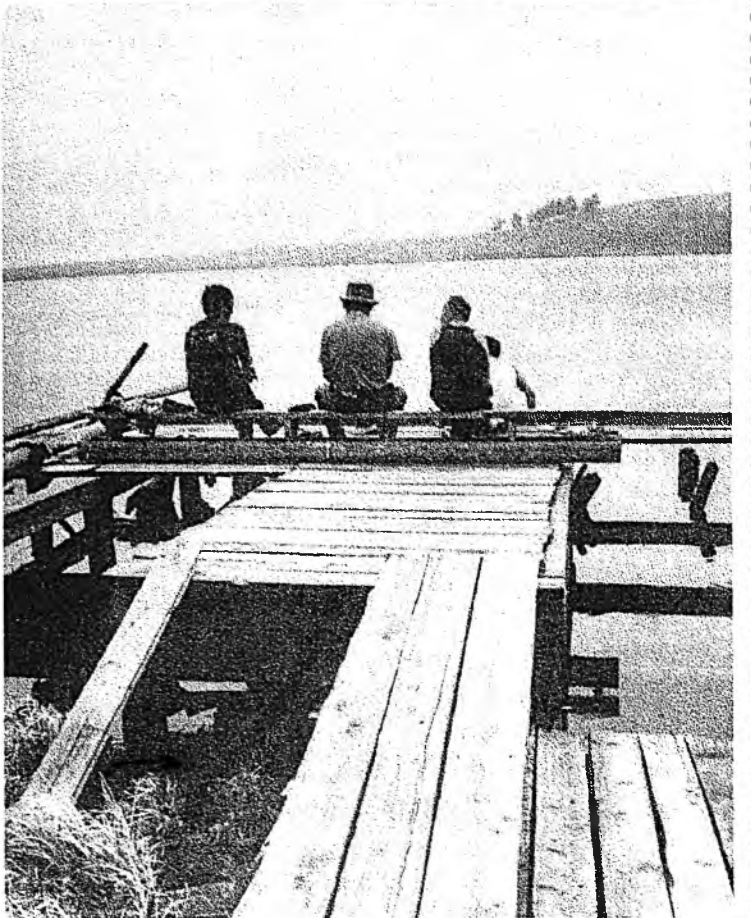
Уһа голлой дуулимда, Зунай үдэрэй дулаанда Зугаалхада аятай даа!