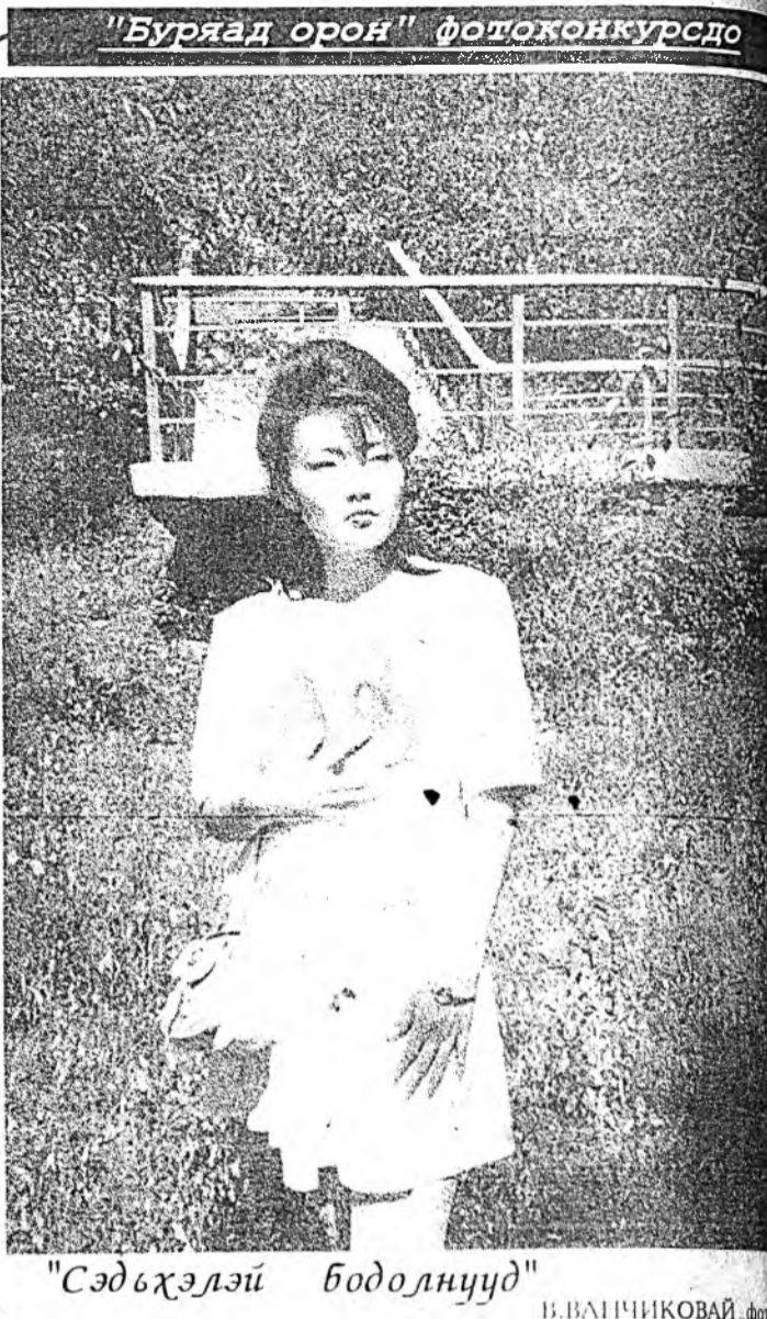
"Сэдхэлэй бодолнууд"

хадуужа абадаг байгаа. Аба, эжынэрнай дүй дүршэл, маяг аашатай хүбүүд, басагадтаа ажалай ябаса соо хургаал үгэдэг байһан гэһшэ. Үхибүүд ана-манга эхэ, эсэгээ хаража, али олон ажалай дүршэл олодог һэн. Айл бүхэн өөрын тухай малай тамгатай, өөһэд өөһэдэйн эмнээ тэмдэгтэй байгаа. Манай үбгэ эсэгэтэн хэдэн үе сагһаа эхилээд, хони хурьгаяа баруун шэхэнэйн урдаһаа дутуу хахад һэтэрхэй хэжэ, мориной баруун гуяда шэнэ нарын, магдажа байһан шэнги нарин, хахад түхэрэһнээ багахан тэмдэгээр эмнидэг байгаа. Хэрбээ уг гарбалаймнай байра байдалай зэр зөмсөгүүд хэдэн үеэр дамжуулагдан хадагалаатай байдаг һаань, ямар һонин, дэмбэрэлтэй байха һэн гэһшэб? Бага балшар һаһанһаань эхилжэ, аха заха хүнине хүндэлхэ, заал һаа "Та" гэжэ хандаха ёһотой байгаа ха юм. Мүнөө хамаагүй болонтожо байна гэжэ һанамаар. Үхибүүдые биһылханууд гэжэ тооложо, һанажа ябадагынь һаань, багануул гэһшэ бүхы юумэ яһала зүб ойлгоод, хадуугаад ябадаг гэлсэдэ даа. Эхин хургуулида миний һуража ябаха сагта, залуу эжи, Батын һама айхабтар гоё нэгэ торгон пулаадтай байгша һэн. Хүндэ үгэнгүй, нарин ниятаар хадагалжа ябаад, тэрээгээрээ хүгшэн эжынгээ нодэ аршадаг байгаа. Энэ пулаадта эхэл хорхойтогшо һэмди. Теэд энэзонийе абажа болохогүй, һаһатай хүгшэн эжымнай сөбөр, зөөлэхэн пулаадаар аршаха ёһотой, хурса нодөөр маанадаа хаража ябаха гэжэ хэлэдэг бэлэй. Залуу эжымнай байд гээд лэ, хүгшэн эжын дороо дэбдидэг хурьганай арһаар оёһон дэбдисиэ һэжэрдэг, сохидог ингэжэ зөөлэхэн болгодог һэн. Аба дэлгүүр ошожо, юумэ абахадаа,