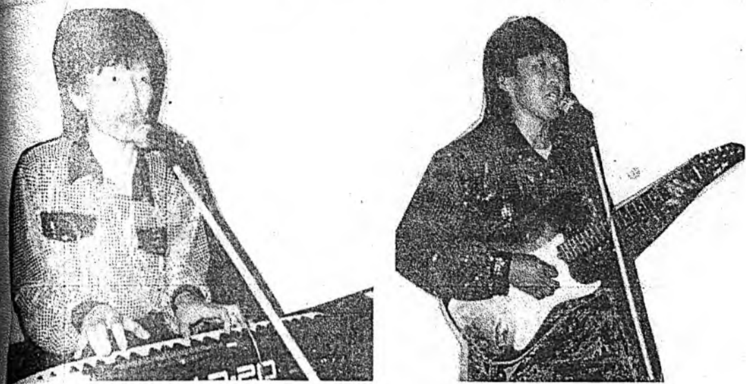
Хүдөөгэй соёлой эдэбхитэд