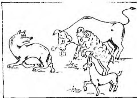
А. Бергеновэй зурал.

Түргэлөөд эдихэ орхиё,— гээд Шүдэлэн тэхын соройходонь, шоно айхабтар