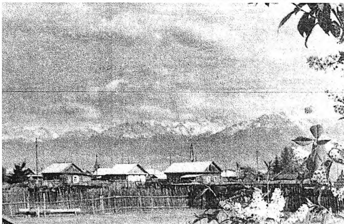
...Саяан уулын хормойдо.