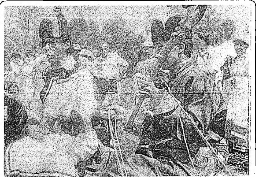
ЗУРАГ ДЭЭРЭ: фольклорой һайндэртэ хабаадагшад.