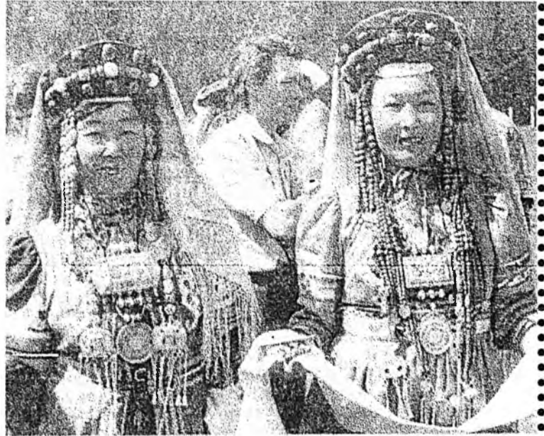
Найр наадандаа сугларжа...