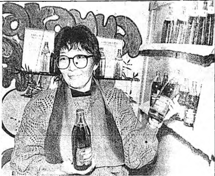
ЗУРАГУУД ДЭЭРЭ: Ниислэл хотодомнай хүдэлжэ байһан яармагта, табигданан Сэлэнгын түйсэнүүдэй, Захаминай пивын хажуугаар ханаа амархан гараха аалши...