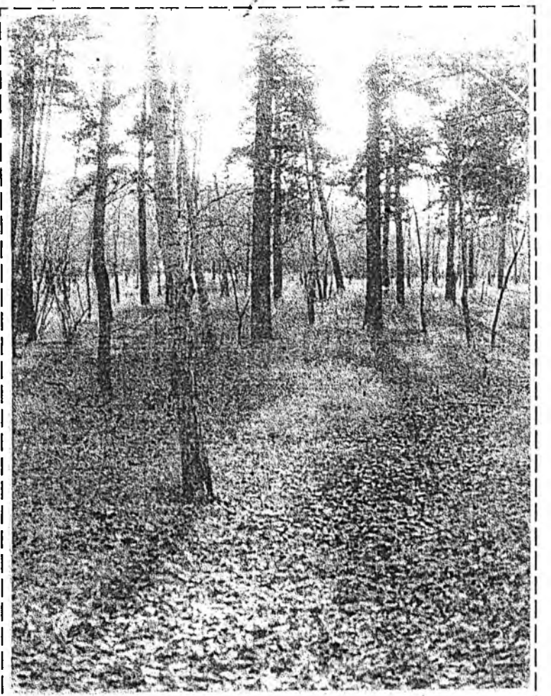
Намарай нюсэгэн ой соо хон-жэн.