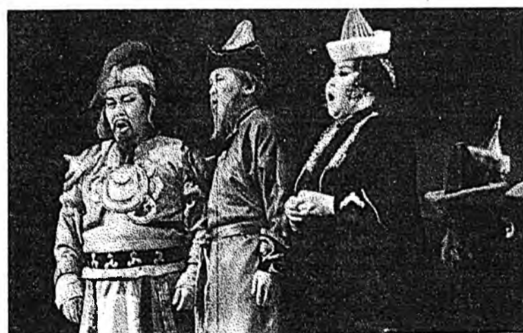
Буряадай оперо болон баледэй академическэ театр 57-дохи сезоноо нээжэ, "Энхэ-Булад баатар" гэхэн классическа оперо (зураг дээрэ) харуулаа. Театрай энэ сезонодо найруулха шэнэ зүжэсүүд тухай манай газетын 8-даху хуудалһанда уншахыетнай дурадханабди.