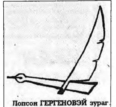
Попсон ГЕРГЕНОВЭЙ зураг

Ногоон зээрэг горхогойни, Ногоон долгөөр сүршүүлжэ һаруул сагаан харьдагийн Сахуур шулуу суглуулжа, Дүүлиин, дүүлиин ябаһанаа Дуулангүйгөөр гарахаалби? Дуррам торгон дайдыень, Дуулангүйгөөр ябахалби? Үнэхөөрөшые, Аха нютагта ошоһон хүн үзэсхэлэнтэ гоё