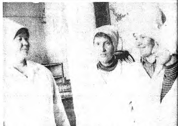
Дэлгүүр: ажабайдал, ажал хэрэг