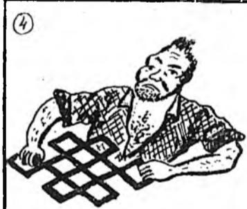
1) Мүнгөө сасаһан гүрэн Муудаха тээшээ бэлэн. 2) Зүрхөөр муушые һаа, Зобоохоб таанадаа хамуураар.