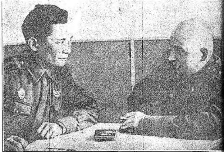
Ж.Е.Тулаевай алба хэһэн сэрэгэй частиин 45 жэлэй ойн бөһолодо Украина ошоо нэмби.

ПВЗ, авиазавод, Галуута-Нуурай ГРЭС, оперо болон баледэй, Буряад драмын театрнуудай ордонгууд, нотагуудай нэргэн бодолго,