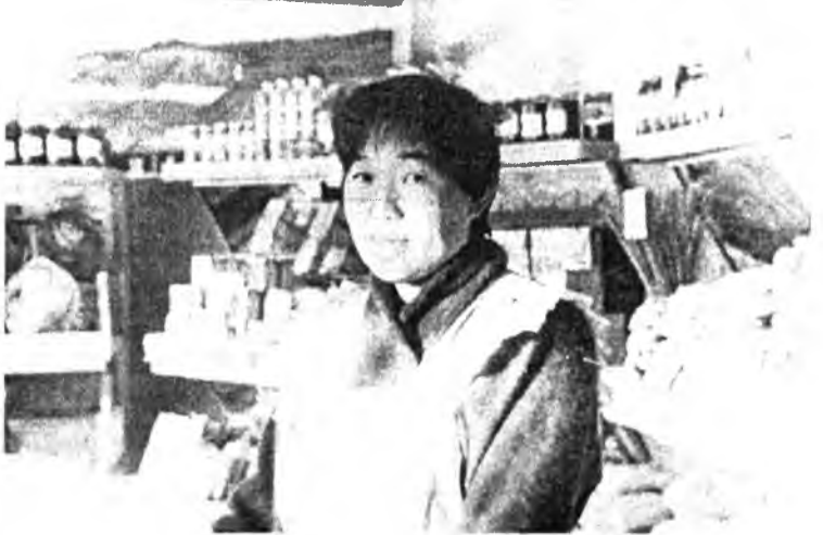
Эмхийн магазин соо

"Бурятскагропромснаб" гэжэ ОАО МТЗ-80, ДТ-75 түхэлэй тракторнуудай болон хүдөө ажыхын бусад машинануудай запас зүйлнүүдые ямаршье гуримай андалгалгаар (бартер), таряагааршье үгэхөөр дурагдаха.