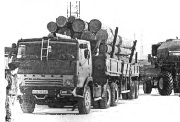
Шэнэ техникэ, запас зүйлнүүдые барилгын модооршые андалдана