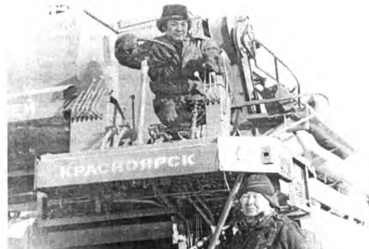
Үшөө нэгэ комбайн Кабанскын аймагта ябуулагдахань