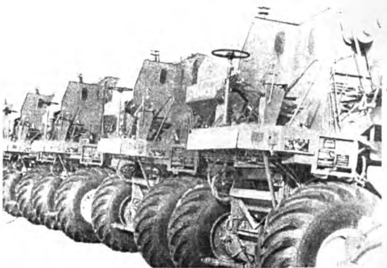
Ажыхынуудта ябуулагдахаар бэлэн болгогдохон комбайнууд