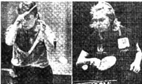
Һайндэртэ энэ мурьсөөн зориулагдана. Буряад Республикын эрдэм хуралсалай министр, Буряад Республикын Столой