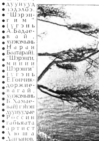
Композитор Баяр Хамаев гэгшэд үгэнсэдхэжэ, зонине ехэтэ баясууһан байна.

Хургуулин шабинарай болон аймагай соёлой таһагай дуушадай ашаар гоё һайхан шүүлэг, дуунууд, хатар наадан табигдажа, энэ һайндэрэйн шэмэг боложо үгөө. Энэ үдэш дээрэ Шэрэнги нотаг тухай шэнэ дуунууд эдэлбэ.