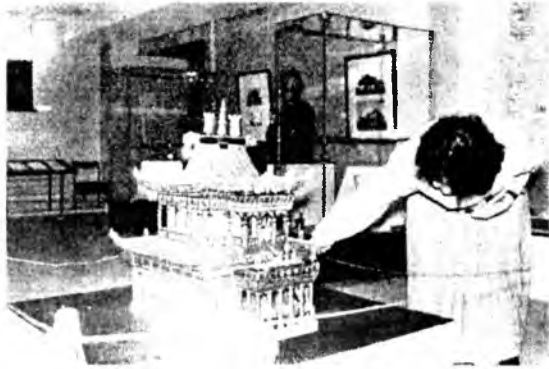
Зүйлнүүдхээ гадна түрүүшын хамба Дамба-Даржа Заягайн малгай, Анаагай, Янгаажанай дасануудай макетүүд дүрбэдэхи бүлэгтэ табигданхай.

Буряадуудай уг гарбал тухай хонирхолтой хэрэгсэлнүүд 2-дохи бүлэгийг эзэлнэ. Тэндэнэ, эрдэмтэн С.П.Балдаевай суглуулбаринаа хэрэгсэлнүүд, захиамин, эхирэд-булагад, хори буряадуудай угай бэшгүүд, бөөгэй хэрэгсэлнүүд, зурагууд олоной хонирхол татамаар юм.