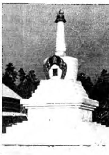
боди хотогто хүргэхэ гэжэ тон хүсэтэйгөөр оролдонон

Тарниин ном (Тантра) имагтал хамаг амитанда туна хүргэжэ, тэдэниие Бурханай