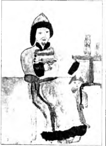
Г.БАБУЕВА, Хэжэнгын интернат хургуули.

МИНИИ ХҮГШЭН ЭЖЫ Хүгшэн эжы тухайгаа хөөрэхэ гэхэдэмни, толгойдом гансал зүрхэ хүдэлгэмэ үгэнүүд ороно. Мини хүгшэн эжы Түнзэнэй Лиза мүнөө тоонто нютаг Ушхайтынгаа баруун тээ ажаһуудаг юм. Хүгшэн эжымнай энэ жэлдэ 65 һанаяа гүйсөө һэн. Хэдышые үндэр һанатай болоошые һаа, эжымнай маанадтаа тон залуугаар харагдадаг юм. Тиигээд бидэ, аша эзэнэрын тиигэжэ харагдаашье һанань, он жэлэй ошохо бүри хүгшэржэл байна гэжэ тухайлнабди. Эжымнай 7 үри хүүгэдээ хүлын дүрөөдэ, гарын ганзагада хүргөө. Тэдэнь булта шахуу айл бүлэ болонхой. Һанаа амар байха гэжэ һанахадамнай, аша эзэнэртээ бүри ехээр һанаагаа зободог юм. Мүнөө бидэндээ хургал заабари хэлэжэ