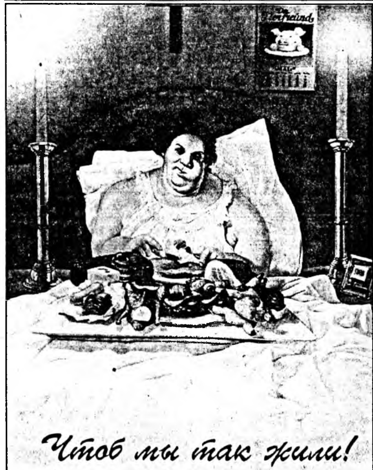
Чтоб мы так жили!

СТРЕЛЕЦ 16-го неблагоприятный день для учебы. Внимательно относитесь к подписанию важных бумаг. 17-го сегодня у Вас может начаться бурный, но скоротечный роман. 18-го постарайтесь не ссориться с домашними, всячески гася конфликты в самом зародке. 19-го успех на работе слегка омрачится разногласиями в семье. 20-го хороший день для переговоров с будущими компаньонами. 21-го благоприятный день для поездки в другой город. 22-го хороший день для серьезных покупок.